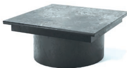
regelbaar verhoog: VHSP600/420

Hoogte: 420 mm Diameter: 570 mm Gewicht: 8 kg