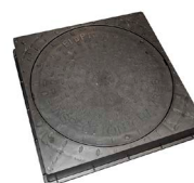
deksel FLP 500 - A15

Hoogte: 600 mm Diameter: 600 mm Gewicht: 15 kg