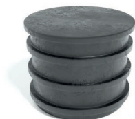
regelbaar verhoog: VHSP500/600

Hoogte: 600 mm Diameter: 500 mm Gewicht: 7 kg