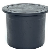
regelbaar verhoog: VHECO

Hoogte: 950 mm Diameter: 600 mm Gewicht: 17 kg