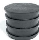
regelbaar verhoog: VHSP600/1200

Hoogte: 1.200 mm Diameter: 600 mm Gewicht: 22 kg