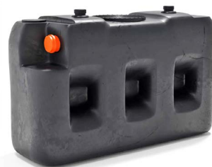
SP3000 RH BM